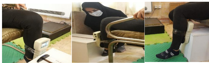
شکل ۴. اندازه‌گیری قدرت با استفاده از دینامومتر

صندلی می‌نشیند. از یک استرپ جهت ثابت کردن ران فرد استفاده شد. برای تست عضله کوادریسپس دینامومتر دستی در زیر استرپی قرار گرفت، که در ۲ سانتی‌متری پروگزیمال مچ پا بر روی ساق پای فرد بسته شد و یک پایه‌ی ثابت در پشت ساق فرد بسته شد از فرد خواسته شد با دستان خود لبه صندلی را گرفته و زانوی خود را صاف کند (۲۰). برای تست عضله همسترینگ استرپ در ۲ سانتی‌متری پروگزیمال مچ پا پشت ساق فرد بسته شد، و به یک پایه ثابت در جلوی ساق فرد بسته شد. از فرد خواسته شد با دستان لبه صندلی را گرفته و زانوی خود را خم کند (شکل ۴) (۲۱).