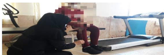
شکل ۲. اندازه‌گیری حس عمقی با استفاده از گونیا متر

به منظور ارزیابی حس عمقی از گونیا متر یونیورسال مدل پترسون برای استفاده شد. از آزمودنی خواسته شد که بر روی تخت بنشیند، پاها از تخت اویزان باشد، به طوری که مرکز گونیا متر بر روی خط مفصلی خارج زانو قرار گیرد. بازوی ثابت گونیا متر در راستای استخوان ران و بازوی متحرک در راستای