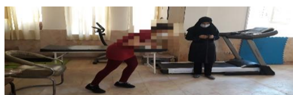
شکل ۳. اندازه‌گیری عملکرد حرکتی